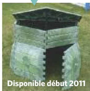
Disponible début 2011